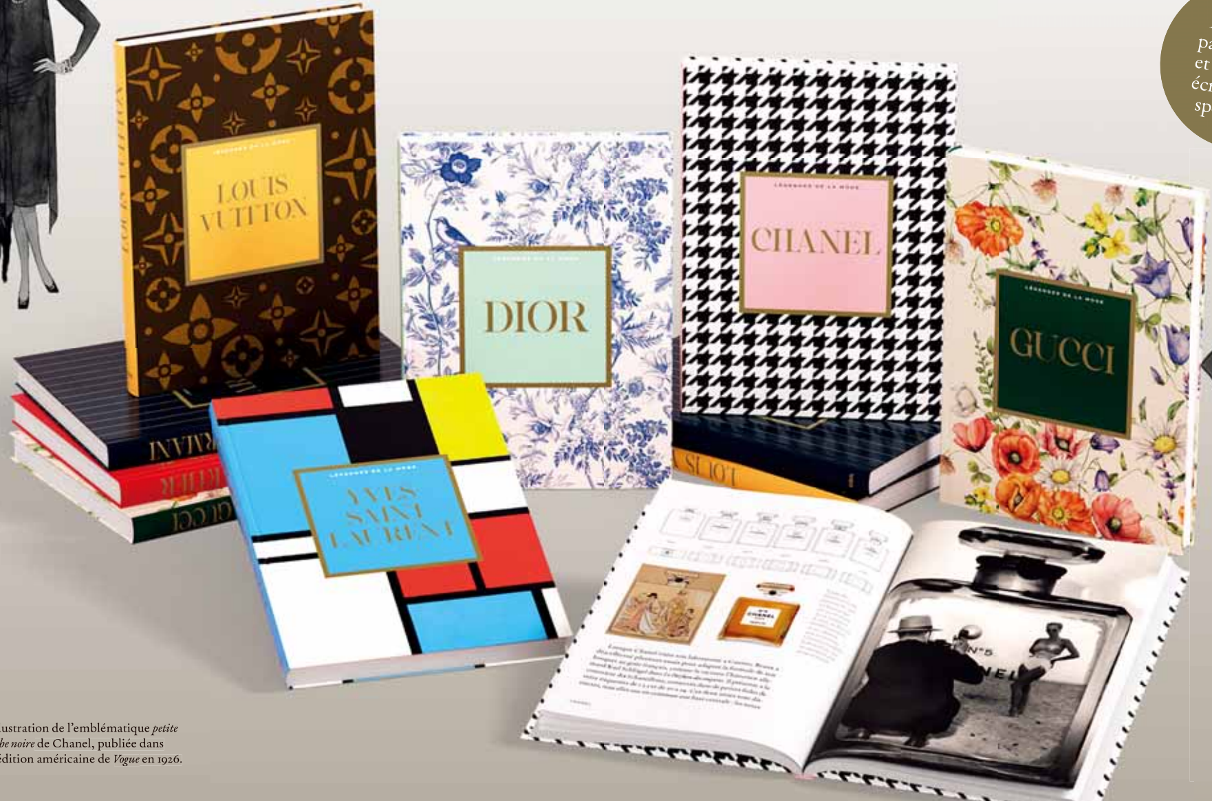
Illustration de l'emblématique petite robe noire de Chanel, publiée dans l'édition américaine de Vogue en 1926.

Des textes passionnants et rigoureux, écrits par des spécialistes