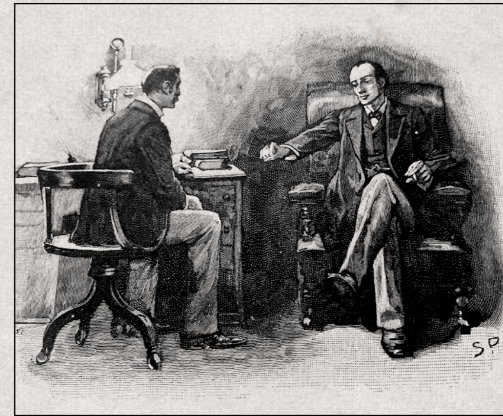
EL DOCTOR WATSON Y SHERLOCK HOLMES, DURANTE EL ENCUENTRO CON THE STRAND CHRONICLE.

Hasta hoy mismo, la versión oficial contaba que Holmes y su gran rival, el malvado Moriarty, habían caído por los vertiginosos acantilados de Reichenbach mientras luchaban cuerpo a cuerpo. Según contó Watson desde el lugar de los hechos, nadie puede sobrevivir a una caída desde tal altura. Y el médico realizó sus propias comprobaciones, deduciendo que ambos habían muerto tras precipitarse al vacío. "Eso era lo que pensaba... hasta hace solo unas semanas", comenta emocionado John Watson a The Strand Chronicle . "Fue entonces cuando conocí a un colec-