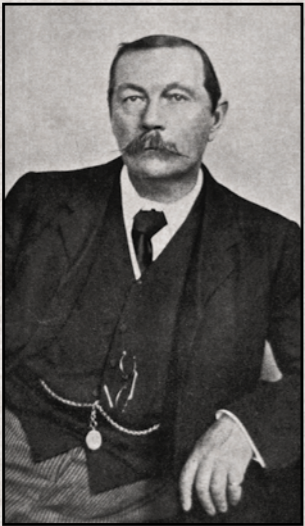
SIR ARTHUR CONAN DOYLE

LONDRES. - Hace solo unos meses que Arthur Conan Doyle regresaba de su misión voluntaria a Sudáfrica, en su doble condición de médico y escritor, y nos regalaba su interesantísimo ensayo La Gran Guerra Bóer , gracias al cual los británicos de la metrópoli hemos podido conocer de primera mano la dureza de la contienda entre el Imperio Británico y los colonos africanos. "Me sentía feliz porque siempre quisiera recibir un bautismo de fuego. No sentí ningún tipo de nerviosismo. Y eso lo debo al hecho de haber mantenido la mente enfocada en otros asuntos", explicó Conan Doyle, ya en Londres, feliz por el éxito de su ensayo bélico.