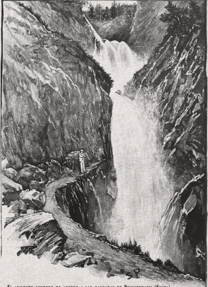
EL ANGOSTO SENDERO DE ACCESO A LAS CASCADAS DE REICHENBACH (SUIZA).

Allí podría permanecer tendido con absoluta comodidad, y oculto a las miradas. Allí estaba yo cuando Watson investigaba de la manera más ineficaz las circunstancias de mi muerte. Pensé que mis aventuras ha-