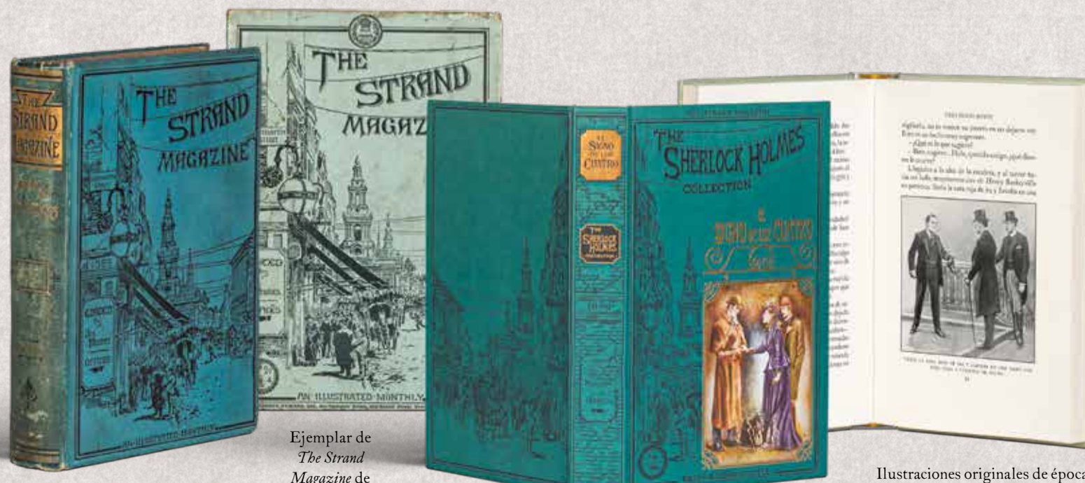
The Strand Magazine encuadernada, año 1894

Una perspectiva de la avenida The Strand, en una de cuyas esquinas se hallaba la publicación, ilustraba la portada original de la revista, cuya cabecera colgaba de los cables del telégrafo. Nuestra colección reinterpreta esa ilustración para sus cubiertas.